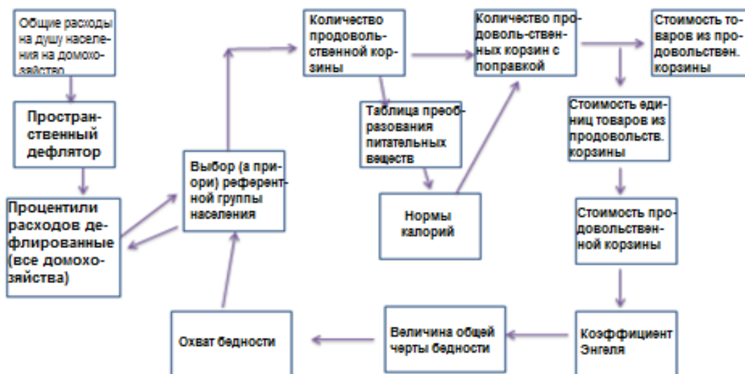
Диаграмма 1. Метод определения стоимости основных потребностей