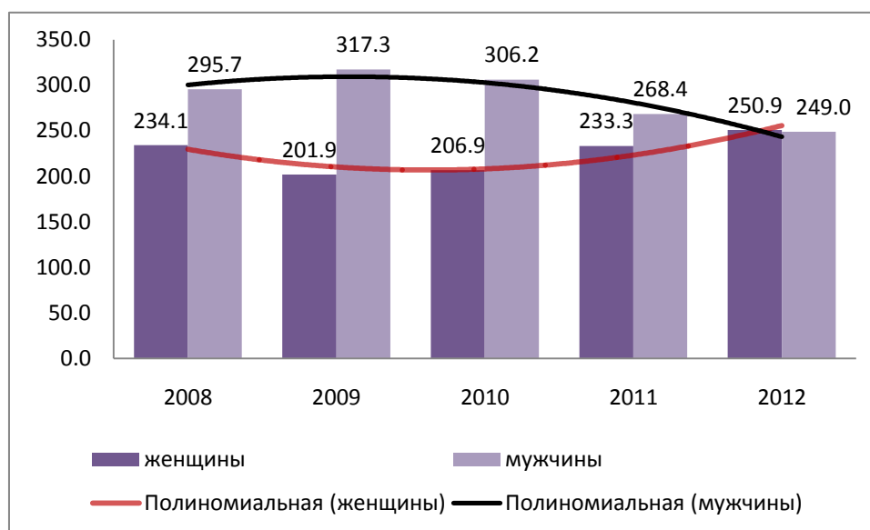
Диаграмма 1. Списочная численность работников в сельском хозяйстве всего, тыс. человек 1

составляет- 75.1%. В свою очередь социально-экономический кризис, высокий уровень безработицы среди мужчин, способствующие падению уровня жизни в стране, стимулировали женскую активность в сфере занятости. Женщина принимает на себя не свойственную ей ранее роль кормильца семьи, что приводит к росту экономической активности женщин. Особенно быстро растет численность женщин в составе наемной рабочей силы, а так же женщин занятых в сфере предпринимательской деятельности.